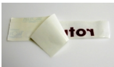
Procedimiento para el pegado final. Colocar el adhesivo boca a bajo y retirar el papel siliconado.