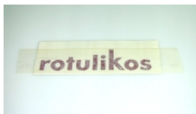
Aquí se ve el adhesivo con el papel transportador ya colocado.