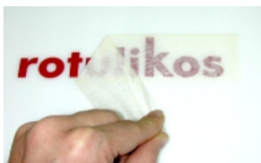
Retirar el papel transportador.