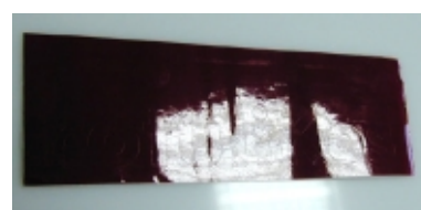
Lámina después de ser cortada. Se puede observar el corte de la cuchilla