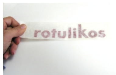
Colocar el adhesivo en su lugar definitivo