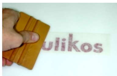
Presionar sobre el adhesivo, siempre del centro hacia las esquinas