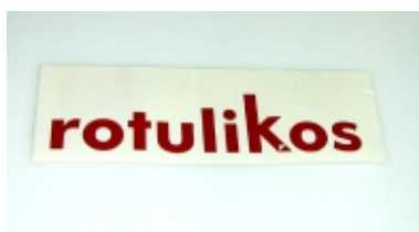
Pegatina una vez realizado el descarte.